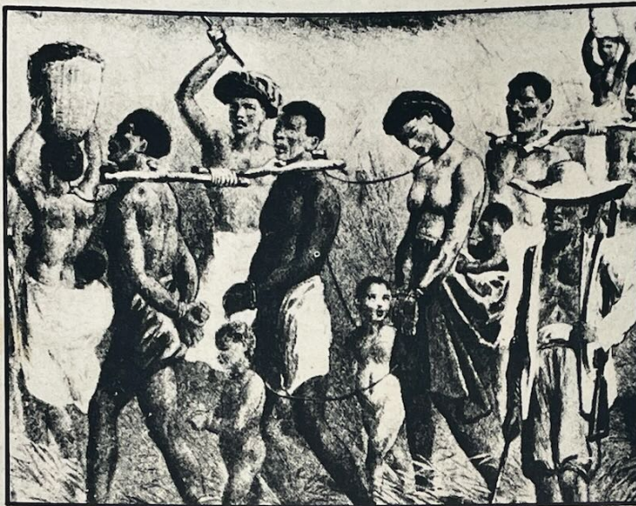
El látigo y el yugo: fueron por siglos de iniquidad lo que más conoció el esclavo.

En realidad, Inglaterra tenía poderosas razones de índole económica que hacían necesaria su política abolicionista. En primer lugar su expansión industrial necesitaba consumidores adecuados, y resultaba lógico que pretendiera sustituir