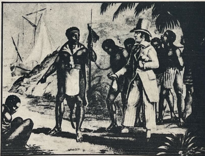
El capitalismo empezó a desterrar el esclavismo, no por humanidad sino por pragmáticas razones imperialistas.

a la servidumbre sin poder adquisitivo por seres "libres", creadores de una sociedad de consumo. Luego, acabar con la rudimentaria producción artesanal y era competencia a la floreciente industria británica. Otro aspecto importante era la necesidad que tenían los ingleses de promover actividades agropecuarias en sus nuevas colonias africanas: el tráfico devastado las costas de África, y ahora, eso iba en contra de los planes británicos, destinados a abastecer de materia prima africana a su población y su industria. Finalmente, el rigor abolicionista británico habría de consagrarse en un salvoconducto para que la marina imperial cumpliera su acción hegemónica en todos los mares (Alberto González Arzac).