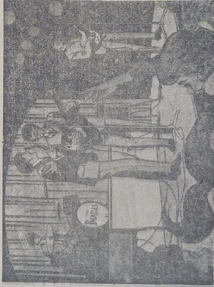
DESPUES DE SUS EXITOS en Lond res y Norteamérica, vino el encuentro memorable con la Reina Madre.

JOHN LENON , El jefe de los Beatles nació el 9 de octubre de 1940, igualmente en Liverpool. Llegó al mundo mientras los ingleses estaban bombardeando las tropas alemanas. Le gustaba dibujar y escribir. Su madre murió en un accidente automovilístico, cuando él tenía 14 años y él fue a vivir con su tía Mimi. Conoció a su esposa en una Academia de Bellas Artes de Liverpool. Trabajó como obrero y es el más rico de los Beatles.